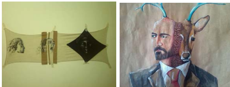
Eigene Arbeiten in Malerei

Da es in der Kunstpraxis nicht auf Worte ankommt, sondern auf das Werken, fühlte ich mich in den Kunstkursen viel aufgehobener und lernte mit Freuden neue Techniken im Bereich der Malerei und des Druckens hinzu. Beim Malen durfte ich, auch durch positive Rückmeldung der Dozenten, feststellen, dass es ein Bereich der Kunst ist, der mir liegt und mit dem ich mich in Zukunft weiterhin auseinandersetzen möchte.