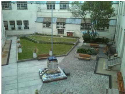
Innenhof der Kunstfakultät

Die ersten zwei Wochen, in denen die Kurse der Universität noch nicht angefangen hatten, nutzte ich, um meine Umgebung kennen zu lernen und ein Gefühl für die Stadt zu bekommen. La Plata ist eine sehr systematisch aufgebaute Stadt, ein riesiges Quadrat, dessen Straßen mit Nummern anstatt mit Namen versehen sind. Dies war für mich, als eine Person, die gerne mal die Orientierung verliert, eine große Hilfe. So schaute ich mir unter anderem die Fakultät der Bildenden Künste, in der ich die nächsten fünf Monate studieren sollte, an. Schon beim Eintreten verspürte ich das Gefühl von großer Vorfreude auf die kommende Zeit. Die Fakultät der Bildenden Künste ist mit zahlreichen Statuen und allerlei künstlerischen Arbeiten geschmückt. In der Mitte der Fakultät befindet sich ein kleiner Innenhof, von dem aus die unterschiedlichsten Töne und Gesänge erklangen. Und nicht nur Studierende gingen in das Gebäude ein und aus, sondern auch Straßenhunde, die dies mit einer überraschenden Selbstverständlichkeit taten. Alles in allem wirkte die Fakultät sehr dynamisch und locker.