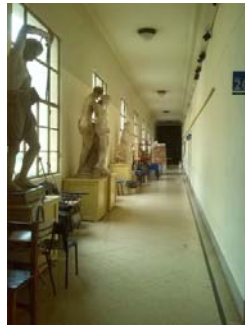
Flur in der Faku