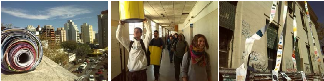
Ausstellung in Druckverfahren

insgesamt ein sehr angenehm offenes Klima, was vor allen Dingen den lockeren DozentInnen zu verdanken war. Der Kurs wurde von vier DozentInnen geleitet, die sich schon seit vielen Jahren kennen und gute Freunde sind. Man hat ihnen die Freude an ihrer Arbeit einfach angesehen und sie schafften es, uns mit ihrer eigenen Begeisterung für die Kunst anzustecken. Ich erinnere mich noch an einen Tag, an dem wir gemeinsam beschließen sollten, wie wir unsere Arbeiten ausstellen wollen. Alle riefen durcheinander Vorschläge in den Raum, wir lachten über nicht ernstgemeinte Vorschläge und lachten dann noch mehr darüber, dass sie doch ernst gemeint waren. Zwischendurch tauchten Ideen wie "Lasst und ein riesen großes Feuer aus unseren Werken machen, auf Trommeln und Gitarren Musik machen und wild ums Feuer tanzen". Gewonnen hat dann jedoch der Vorschlag, alle Werke aneinander zu kleben, mehrere Rollen daraus zu formen und sie zeremoniell vom Unidach zu schmeißen, sodass sie im Wind flatternd an der Wand runter hängen. Diese Erfahrung war eine meiner schönsten Erlebnisse in La Plata, denn sie hat mir gezeigt, wie viel Spaß man haben kann, wenn man seinem verrückten Ideenimpuls folgt und sich nicht von äußeren Normen einschränken lässt.