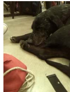
Hund im Hörsaal