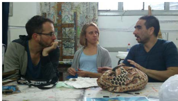
Beratungsgespräch mit Dozenten

In dem Kurs Druckverfahren habe ich viele nette Menschen kennengelernt. Die Uni half mir sehr, mich mit Menschen zu vernetzen und Freunde zu finden. Gerade in diesem Kurs waren die Studierenden untereinander sehr an den Arbeiten der anderen interessiert. Es herrschte