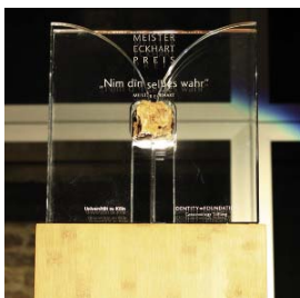
Meister Eckhart Preis 2007